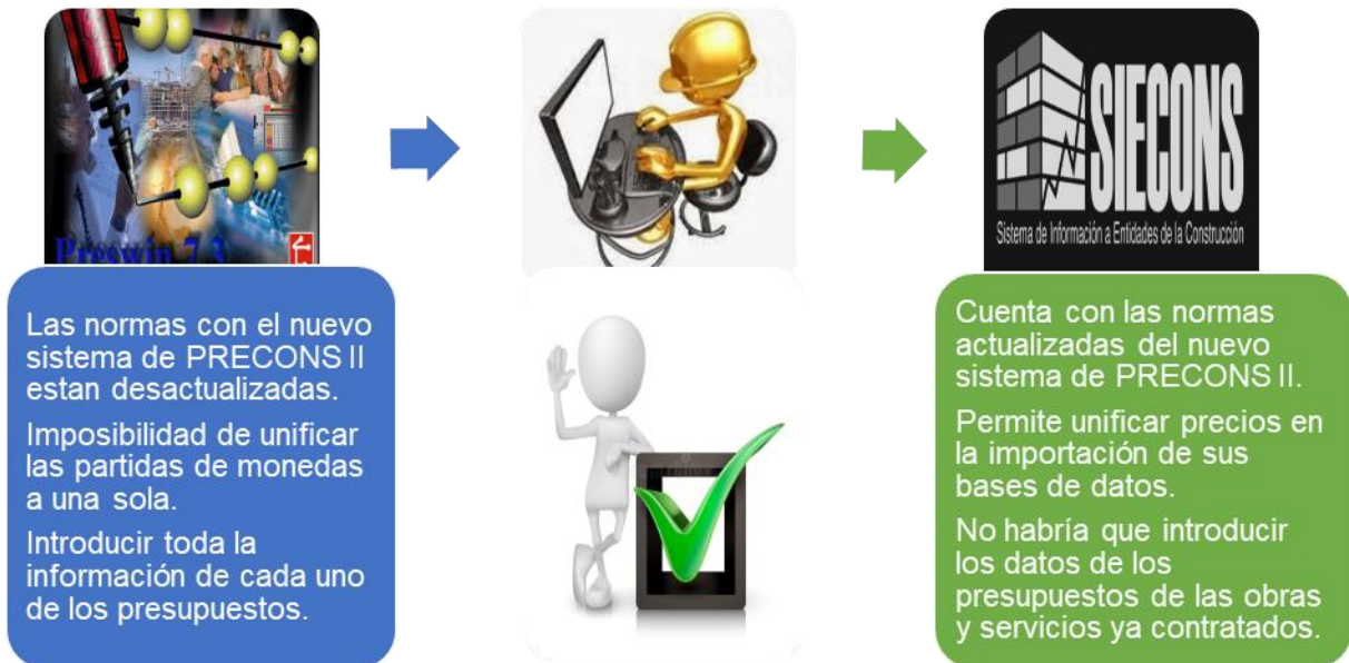
Figura 3. Valoración gráfica del cambio caso estudio.

cubanos, que vinculan a la instrumentación del software SIECONS, con los objetivos estratégicos de la Sucursal.