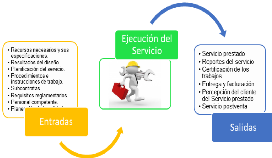
Figura 2: Proceso de Ejecución del Servicio.

encuentran el Cálculo de Presupuestos y Programación de Recursos en Obras de Arquitectura e Ingeniería; ejecutados principalmente por los técnicos y especialistas. El Ministerio de la Construcción (M ICONS) de la República de Cuba tiene establecido varias herramientas informáticas para realizar estas arduas labores, con el apoyo de la Empresa AICROS se materializan estos procedimientos convirtiéndolos en software que ponen a disposición del empresariado dedicado a las actividades de Construcción y Montaje en el país.