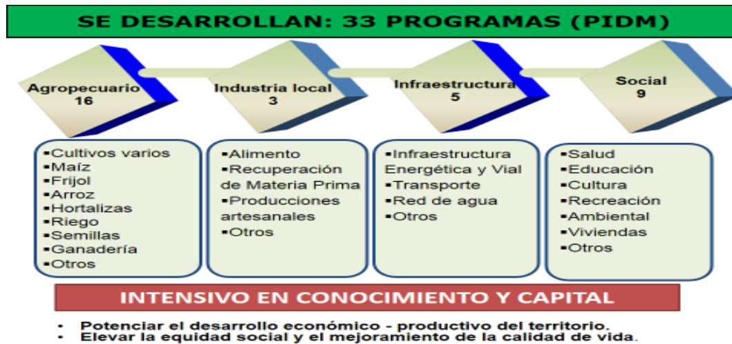
Diagrama 1. Programas de DM de Perico.

local, el incremento de la alimentación y los servicios, la generación de empleos, y del sistema de asentamientos como sustento del desarrollo sostenible". (PIDM de Perico, 2014). Este está organizado en 33 Programas. De ellos 16 Agropecuarios, 9 Sociales, 5 de Industria Local y 3 de Infraestructura.