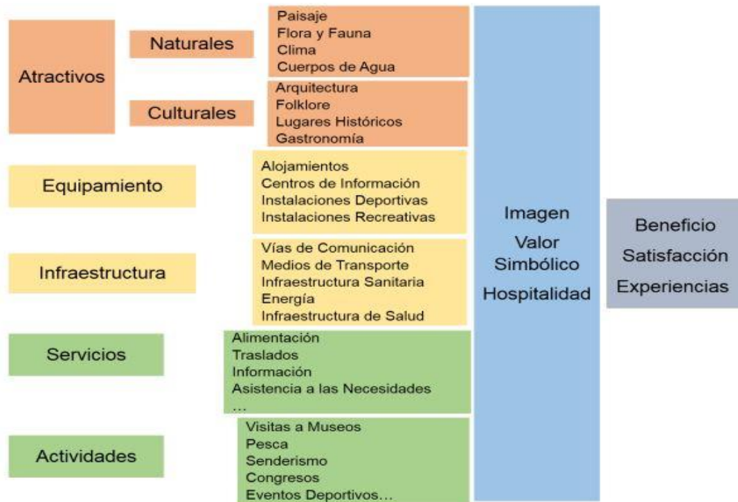
Figura 1: Componentes del destino turístico.

Así como los productos se estructuran a partir de los recursos del destino, éste en contrapartida se estructura a partir de los productos o dicho de otra manera, la estructura de