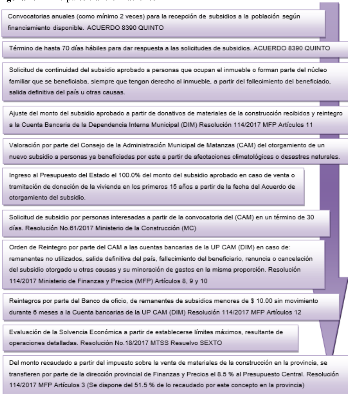
Figura 1.1 Principales transformaciones