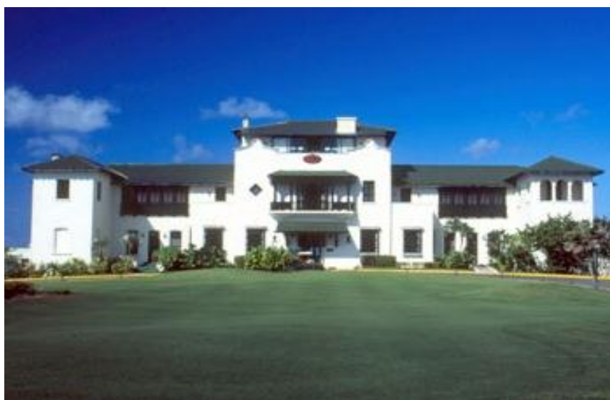
Fig. 1. IMAGEN DE LA CASA DUPONT Y HOY CASA CLUB “LAS AMÉRICAS”

En el año 1959 el país contaba con cerca de 10 campos para la práctica del golf, distribuidos en La Habana, Santiago, Camagüey y por supuesto en el principal balneario del país, Varadero. Como ejemplo de estos campos se puede mencionar el Colina Villa real Golf Club, otros campos fueron el Biltmore Golf y Yatch Club, el Country Club, Robert Club (actualmente Habana Golf Club) y el campo de Golf de Varadero (campo de Dupont o Peñas de Hicacos), asociado a la residencia de los dueños (fig. 1).