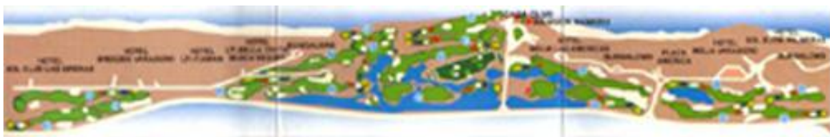
FIG. 3. IMAGEN DEL CAMPO DE GOLF ACTUAL DE VARADERO

Ubicado en la provincia de Matanzas, en la península de Varadero, el Varadero Golf Club (Fig. 3) ocupa una franja estrecha de 3,5 Km. de largo, bordeando los Hoteles “Breezes Varadero”, “Tuxpan” e “Iberostar Bella Costa”, “Meliá Las Américas Golf y Suites Resort”, “Meliá Varadero” y “Sol Palmeras”. Este, fue diseñado por el Arquitecto Les Furber, Presidente de la Compañía Canadiense Golf Design Cervices Ltd (GDS), es el primer campo de 18 Hoyos par 72 de Cuba, en él se combinan el bogey fácil y el difícil, convirtiéndole en uno de los mejores concebidos del circuito de campos de todo el Caribe, sitio donde deporte y elegancia se combinan.