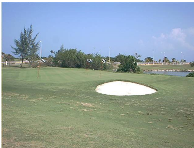
Fig. 6. Zona de shipping greens y bunkers

Este campo ha sido sede de las ediciones de la Gran Final del European Challenger Tour en los años 1999 y 2000, la Final del Circuito AUDI de España en el año 2001 y el Pro Am The Sherritt International en 1998, 2000 y 2002. Además, con carácter anual, se organizan la Copa Hispanidad y la Copa Cuba Golf.