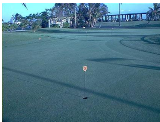
Fig. 5. Zona de putting greens