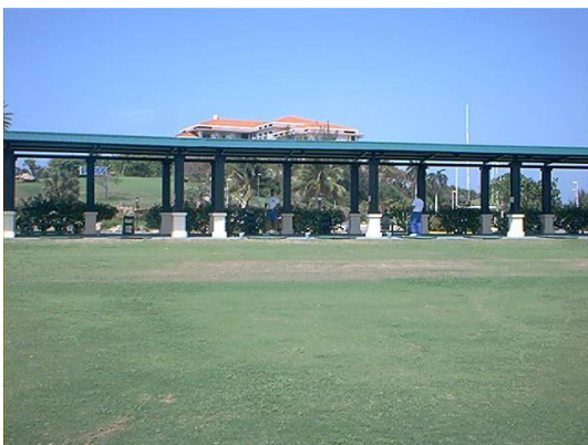
Fig. 4. Zona de 300 metros para juego largo.

Esta Academia de Golf cuenta con 2 profesores instructores y un Profesional de Golf y concibe diferentes programas regidos por las disposiciones, reglas y ética del deporte a nivel internacional, abierta para todos los profesionales y sus estudiantes que deseen disfrutar de un apasionado deporte rodeados de las maravillosas playas y cultura cubana. Cuenta con gran calidad de estructura en las áreas de práctica: zona de 300 m para el juego largo (Fig. 4), 2 putting greens (Fig. 5), un shipping greens y 2 bunkers (Fig. 6), instrucciones en áreas techadas y el empleo de accesorios, cuenta con modernos equipos alimentados con energía eléctrica para evitar los efectos de la contaminación acústica ambiental.