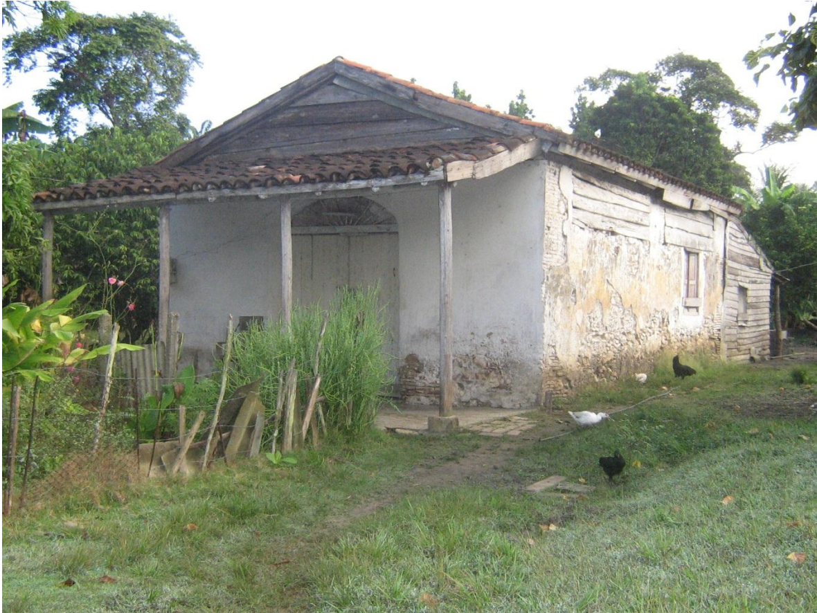
Casa Templo de Aguedita.