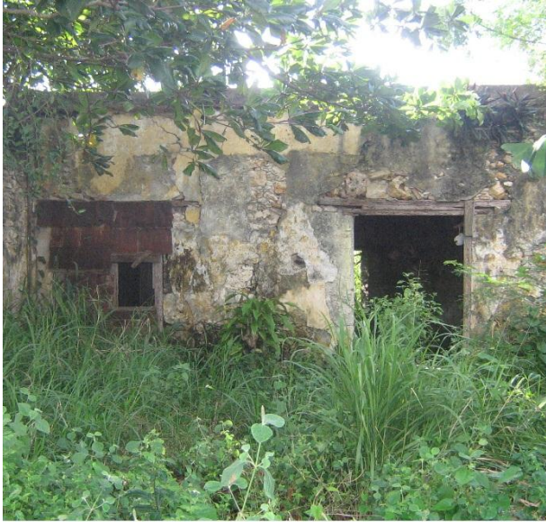
Ruinas del Barracón de Aguedita.