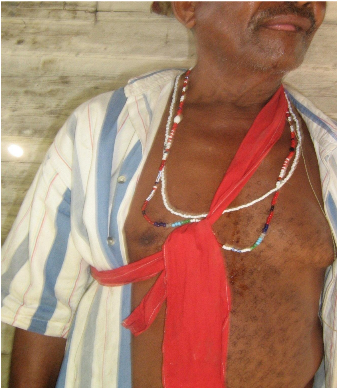
Palero de Aguedita.