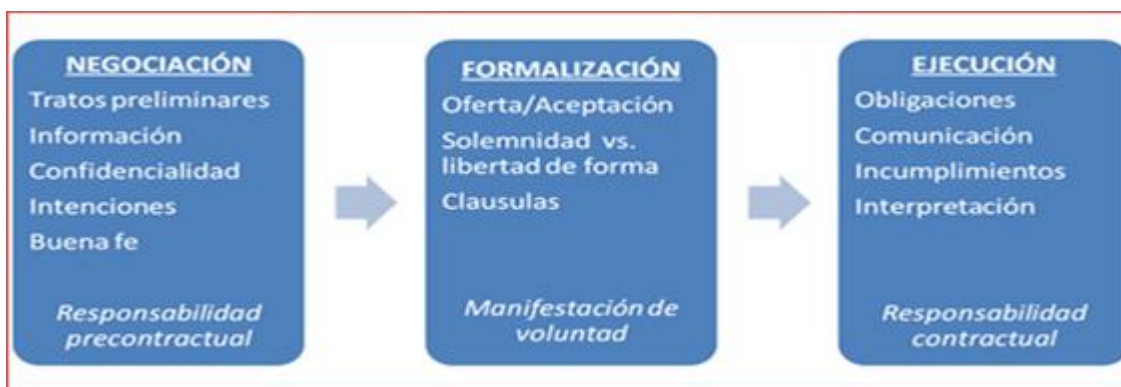
Figura 1. Etapas de la Contratación

El contrato económico, es la principal fuente de las obligaciones; es decir es el instrumento de que se valen los hombres para sus relaciones jurídicas, en función de los intereses de la clase trabajadora, la primacía de los intereses sociales sobre los individuales y la no contratación de los intereses de los individuos de la sociedad. A continuación se presenta la figura 1, las cuales muestran su explicación: