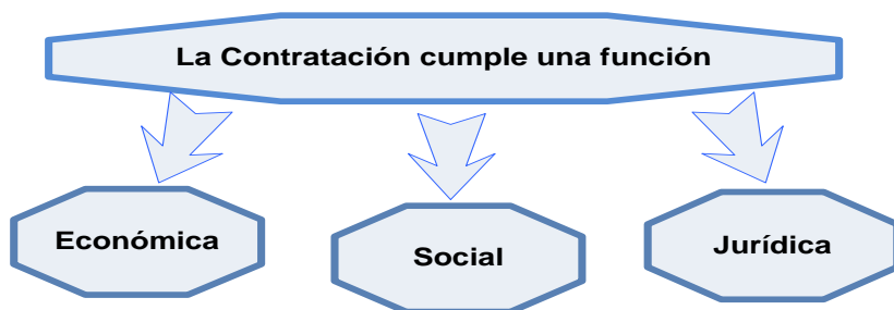
Figura 3. Funciones del Sistema de Contratación Económica

En los análisis realizados por diferentes autores se logra asociar tres funciones principales al sistema de contratación económica ver figura 2.