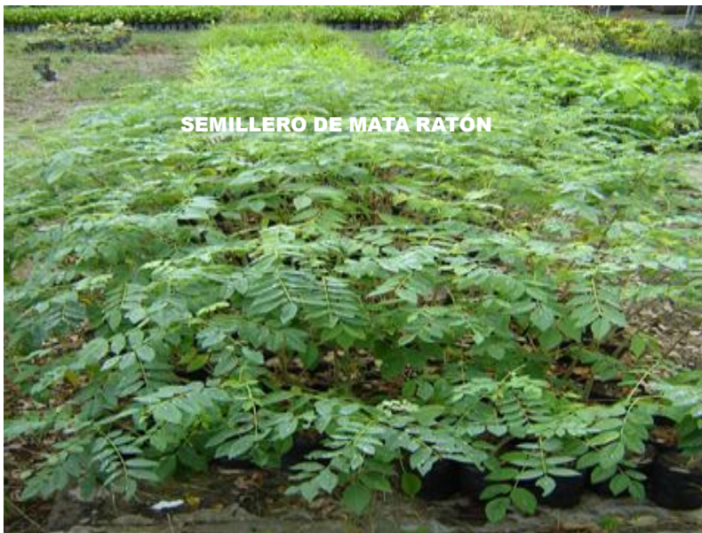
Figura 2. Semillero de mata ratón en el área del vivero del Campamento agroturístico Doña María y Don Guillermo. Farfán, septiembre 2012.

Se aplicaron métodos de propagación sexual y asexual para todas las especies de plantas con representación inferior a quince ejemplares en el área seleccionada, según criterios de FAO, (2007) y experiencias de Robledo (2013). La producción de posturas se obtuvo en el vivero de la zona seleccionada para la granja la turística en los años 2011 y 2012, entre los meses de mayo, junio como está establecido para las especies seleccionadas en los manuales de viveros y utilizando además criterios de Webb, y Smith (1984). (Figura 2).