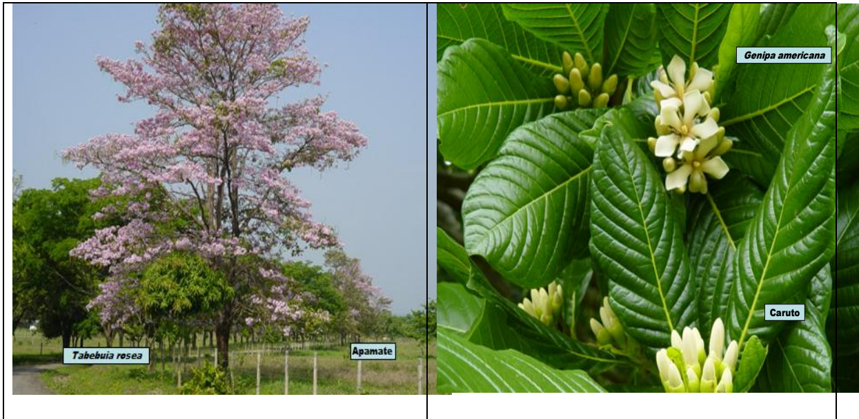
Figura 1. Valores de la flora presentes en el Campamento agroturístico Doña María y Don Guillermo. Farfán, septiembre 2012.

Se aplicaron métodos de propagación sexual y asexual para todas las especies de plantas con representación inferior a quince ejemplares en el área seleccionada, según criterios de FAO, (2007) y experiencias de Robledo (2013). La producción de posturas se obtuvo en el vivero de la zona seleccionada para la granja la turística en los años 2011 y 2012, entre los meses de mayo, junio como está establecido para las especies seleccionadas en los manuales de viveros y utilizando además criterios de Webb, y Smith (1984). (Figura 2).